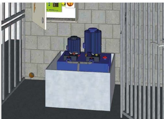
Bac de rétention non contractuel (non fourni)

Il est recommandé que la centrale hydraulique et le coffret de manœuvre soient tous deux installés dans un local fermé ,éclairé ,ventilé et réservé à l'élèveur,